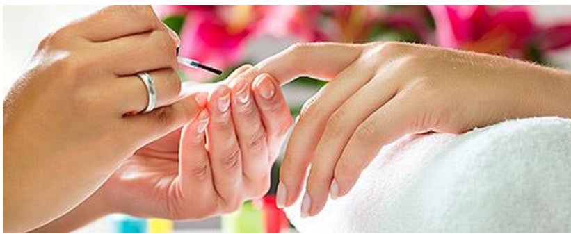
Оказание косметических услуг на дому