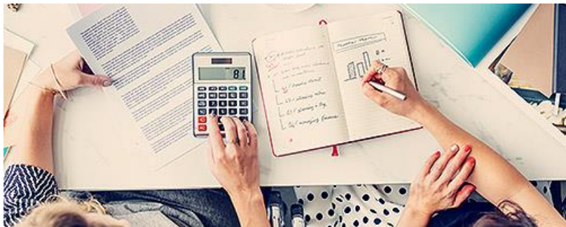
Юридические консультации и ведение бухгалтерии