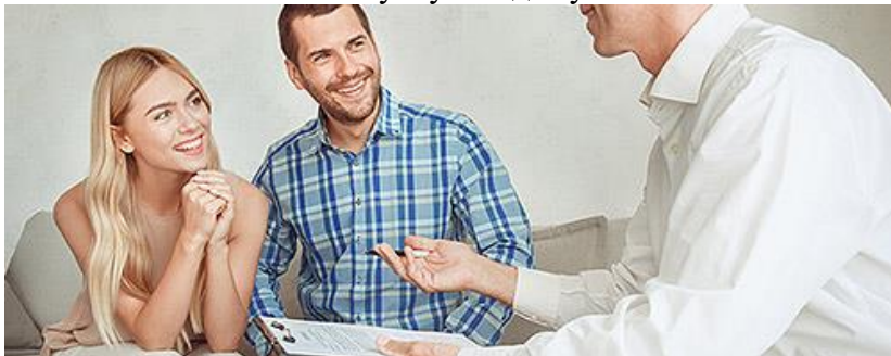
Сдача квартиры в аренду посуточно или на долгий срок