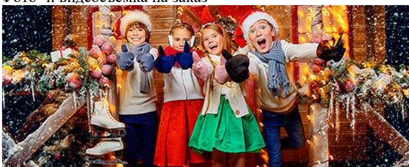
Проведение мероприятий и праздников