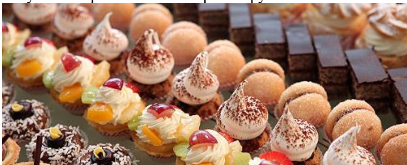
Продажа продукции собственного производства