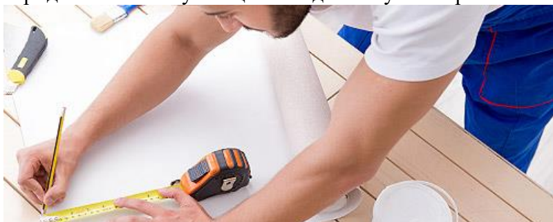
Строительные работы и ремонт помещений

Для получения консультации или оформления социального контракта на самозанятость обращайтесь в учреждение социальной защиты населения по адресу: