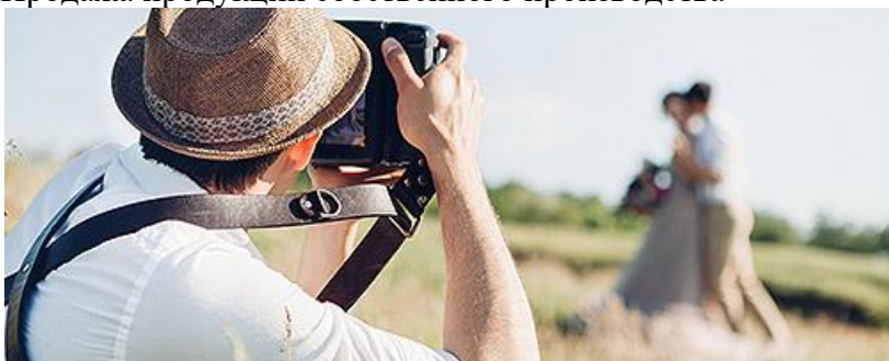
Фото- и видеосъемка на заказ