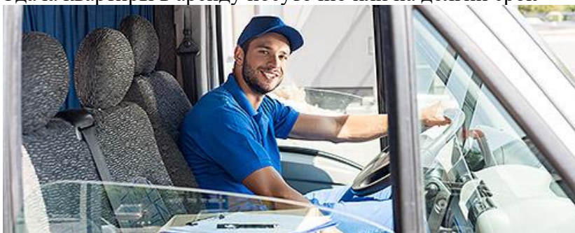
Услуги по перевозке пассажиров и грузов